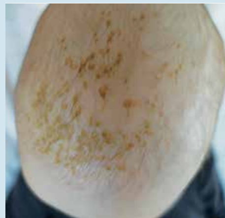
Рис. 2. Гнейс у 6-месячного ребенка. Плотные чешуйко-корочки светло-коричневого цвета