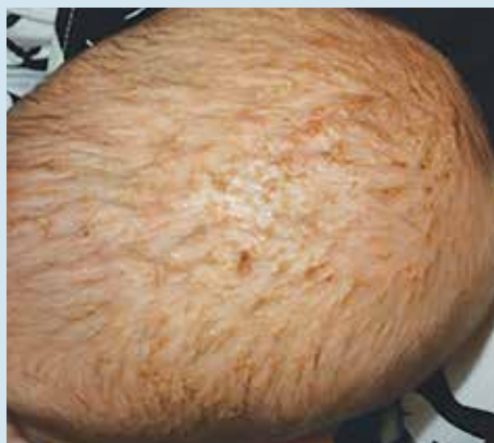
Рис. 5. Себорейный дерматит волосистой части головы, развившийся у 4-месячного ребенка после механического удаления чешуйко-корочек