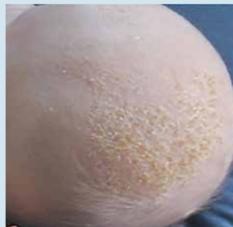
Рис. 4. Сухие корочки при гнейсе после обработки кожи волосистой части головы у 4-месячного ребенка