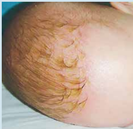
Рис. 1. Гнейс у новорожденного ребенка. Сальные чешуйко-корочки на волосистой части головы

ет многим исследователям считать гнейс разновидностью младенческого себорейного дерматита [8]. В своем исследовании R. Ruiz-Maldonado и соавт. культивировали Malassezia у 73% младенцев