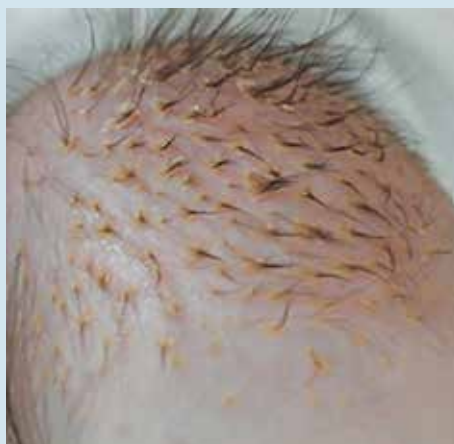
Рис. 3. Гнейс у новорожденного ребенка. Чешуйко-корочки после мытья головы